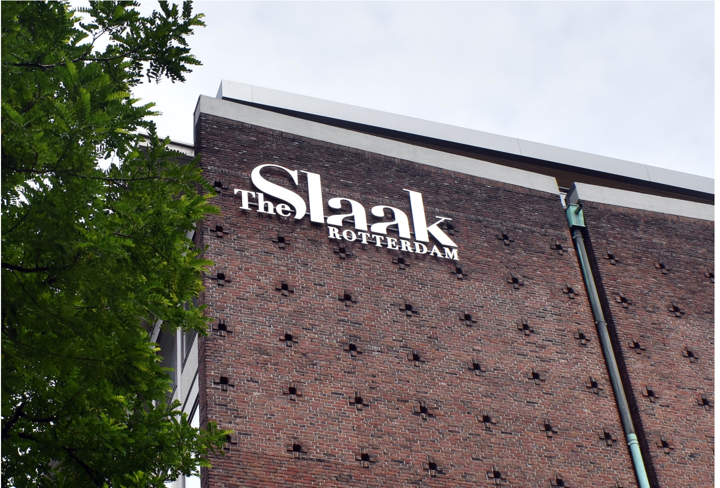
Hotel The Slaak - Slaakhuys ter Rotterdam