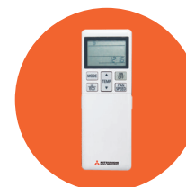
Infrarood bediening RCN-TC-24W-E2