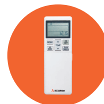
Infrarood bediening RCN-TC-24W-E2